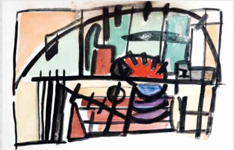
Jilali Gharbaoui. Sans titre. 1957. Gouache sur papier. 38,5 x 57 cm. COLLECTION ATTIJARIWAFABANK

De sa formation en France à son court séjour en Italie avec les premiers tableaux gestuels non figuratifs.