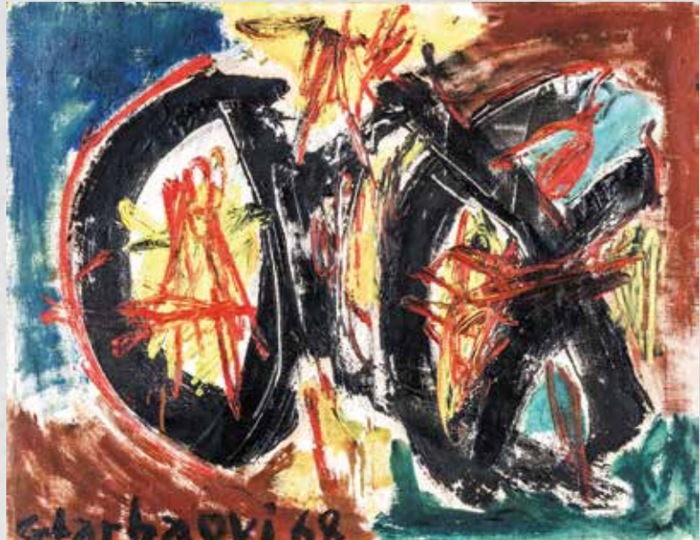
Jilali Gharbaoui. Composition . 1968. huile toile 50*65. COLLECTION FONDATION AL MADA