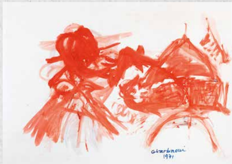
Sans titre. Gouache sur papier. 75 x 105 cm. 1971. COLLECTION ATTIJARIWAFABANK

Espoirs de l'exposition rétrospective proposée par Pierre Gaudibert au Musée d'art moderne de la Ville de Paris, allers et retours entre le Maroc et la France, solitude puis décès à Paris.